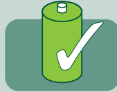
Daima tam güç