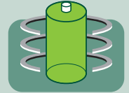
Uzun kullanım ömrü