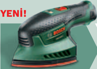
PSM 10,8 LI