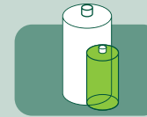
Diğerlerinin yarısı kadar ama onlarla aynı performansta